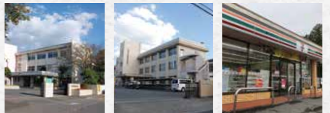
河和田小学校約800m 赤塚中学校約1,600m セブンイレブン約350m